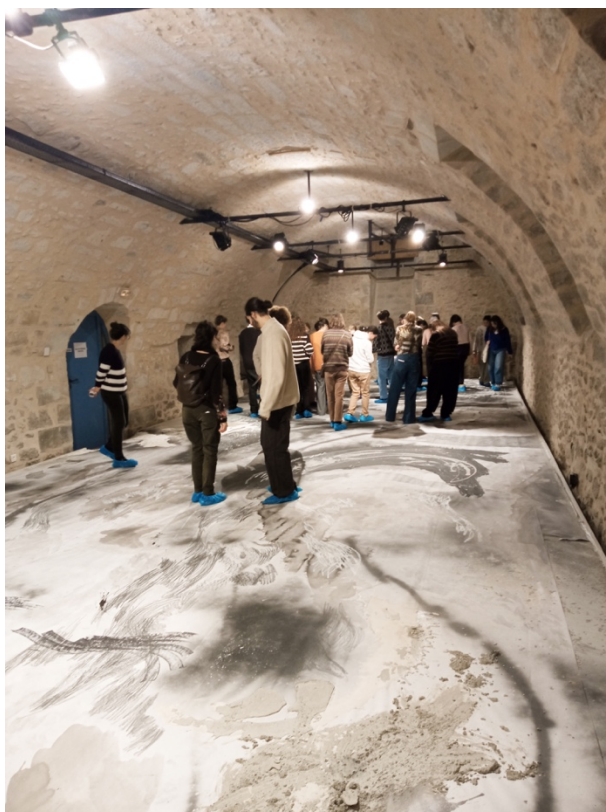
Vue d'ensemble de la restitution de la résidence itinérante L'ELAN #1 à l'Agence Culturelle Départementale Dordogne-Périgord à Périgueux, installation, fresque, acrylique, crayon graphite, encre de Chine, fusain, plâtre, pigment, béton, 20m x 6m, 2023 @Claire Bodin Villanneau