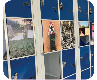
Au collège Jean Ladignac - Saint- Cyprien